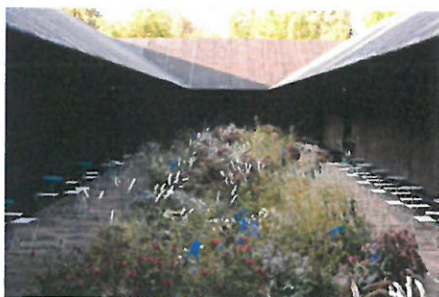
118 Květná zahrádka (Serpentine Gallery Pavilion 2011 / Peter Zumthor, Piet Oudolf)