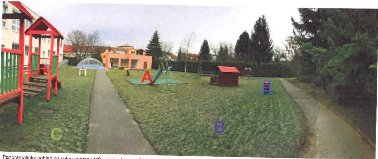
Panoramatický pohled na celou zahradu MŠ, vzadu vlevo krytý bazén, zcela vlevo objekt MŠ