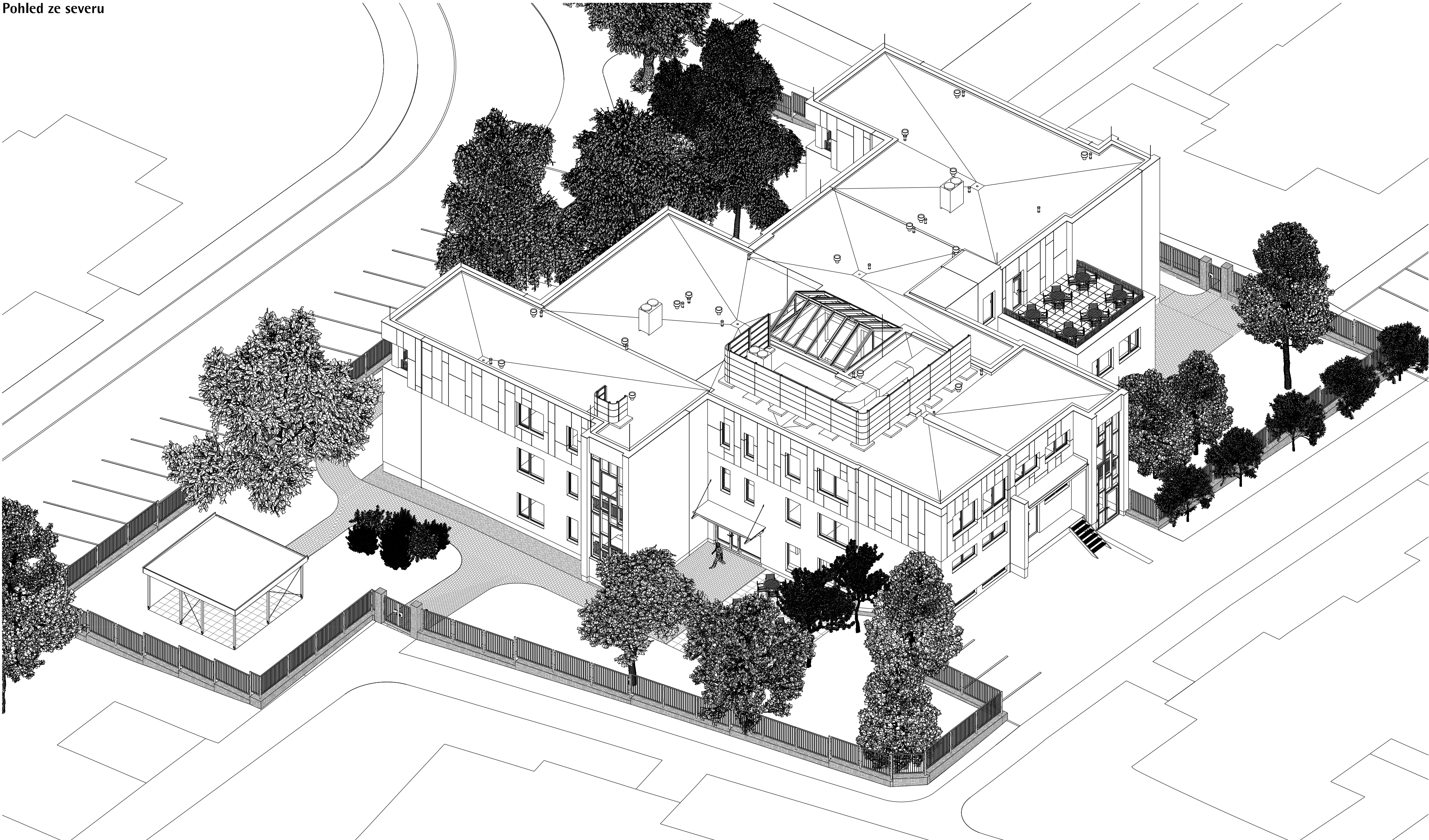
Pohled ze severu

Poznámka Od okolních domů jsou zakresleny pouze půdorysné otisky.