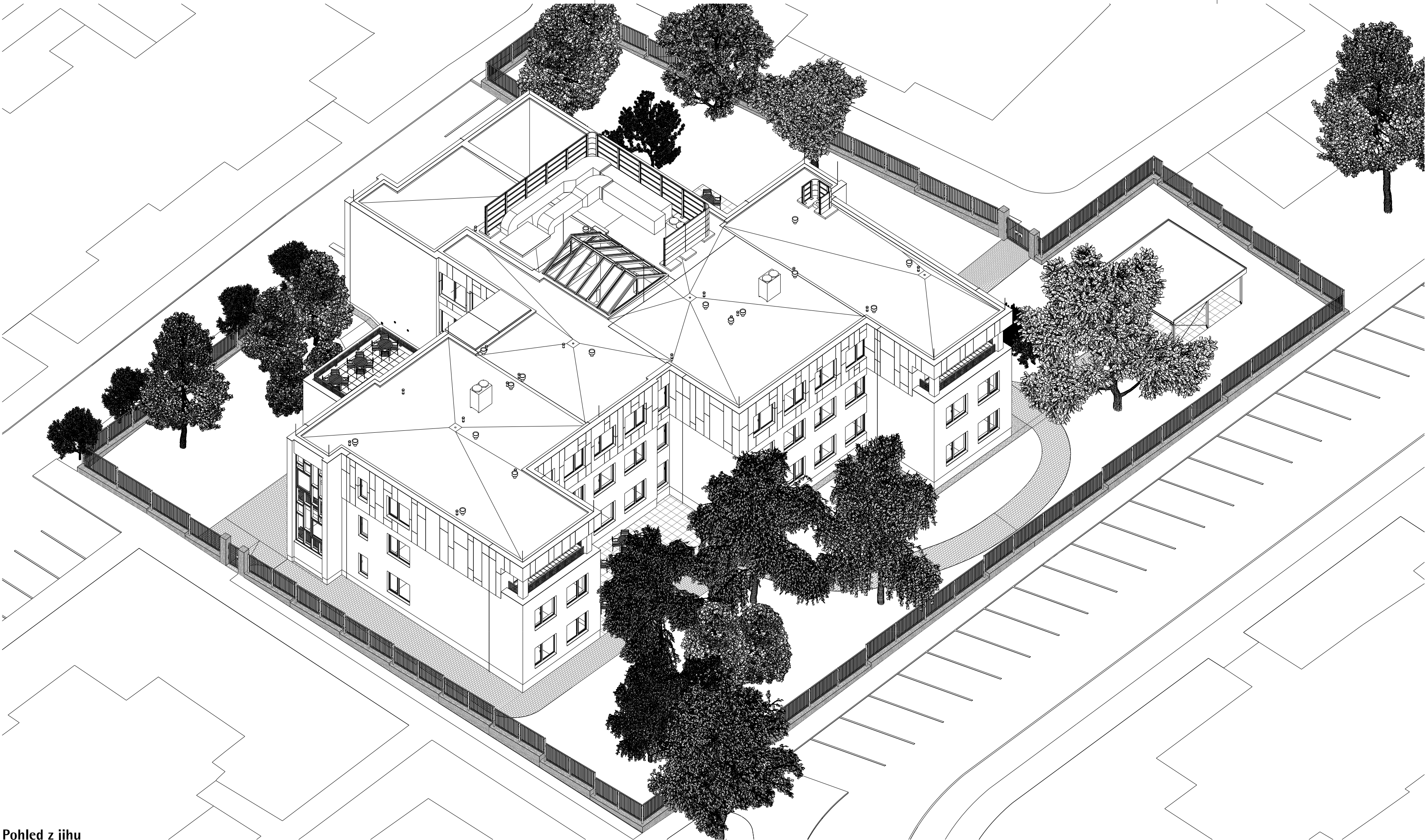
Pohled z jihu