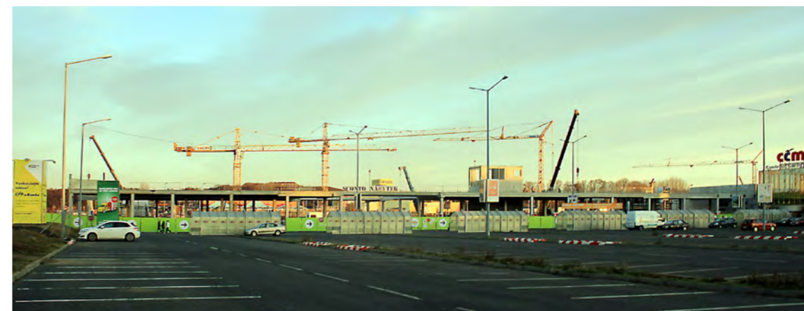
ZDROJ: Havlovec, Vojtěch - Linka č. 141, https://magazin.aktualne.cz/cerny-most-aechitektura-linka-141/r~34113986fbf11e882ca0cc47ab5f122/